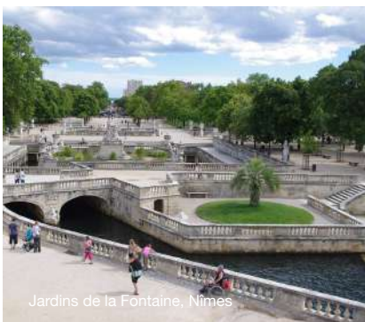
Jardins de la Fontaine, Nîmes

Die Anmeldung wird bestätigt, vor Abreise erhalten Sie schriftlich weitere Informationen