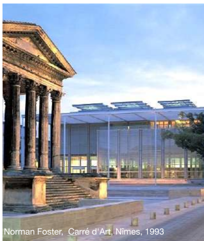
Norman Foster, Carré d'Art, Nîmes, 1993

Wir schliessen unsere Reise durch ein langes Tal voller Tradition in den Bouches-du-Rhône ab. Eine Reise, die uns vom Gletscher dem Rotten entlang, zunächst nur ein sandiges Rinnsal, nach Brig und Siders führte, wo der Fluss dann zur Rhone anschwillt, bei Sion plötzlich mächtig wird und beim Durchschreiten der Pforte, die das Tal bei Martigny abschliesst, jäh auf die weite Wasserfläche, des Lac Léman trifft, dem wir über Montreux, Vevey bis Lausanne folgten. Auf der französischen Seite gelangten wir nach Genève, stromabwärts bis Lyon, der geschichtsträchtigen Metropole mit ihrer aussergewöhnlichen Architektur. Die Reise führte uns weiter über das Kloster Sainte-Marie de la Tourette nach Vienne und Avignon, Städte, die über die alte Rhône berichten, die römischen Galeeren, die Theater, die vergangene Zeit, die zugleich die gegenwärtige ist. Jetzt endlich sind wir am Mittelmeer. Am Ort, an dem es am ehesten möglich ist »ja« zur Welt zu sagen: die Sonne, das Meer, die Schönheit.