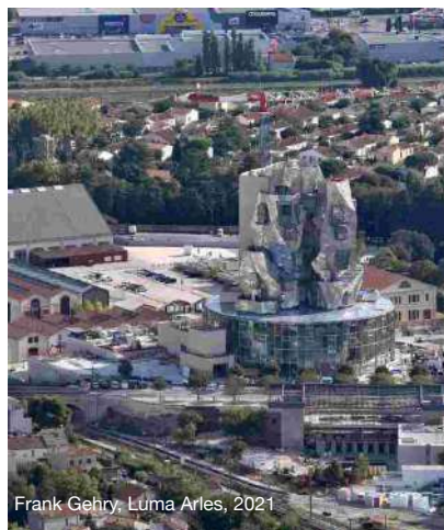
Frank Gehry, Luma Arles, 2021